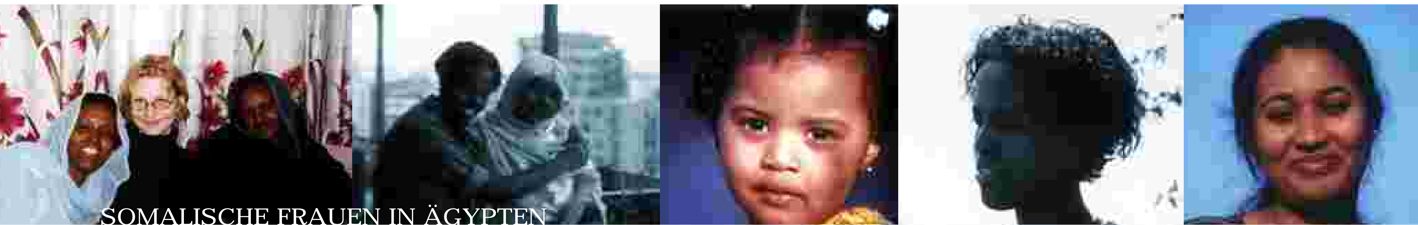
SOMALISCHE FRAUEN IN ÄGYPTEN